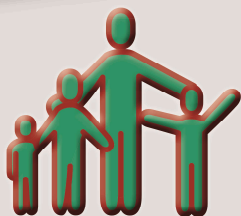
Jugend- und Nachwuchsarbeit